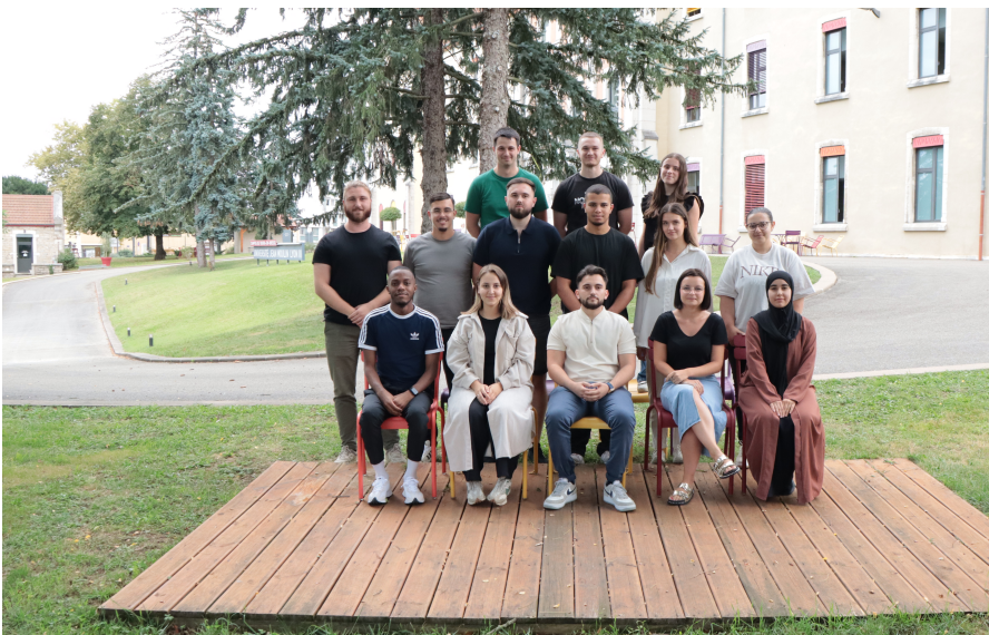
Photos des promotions 2022-2023