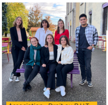
Association «Droit au B.U.T»