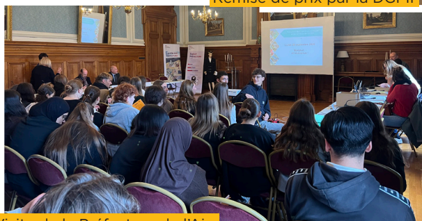
Visite de la Préfecture de l'Ain