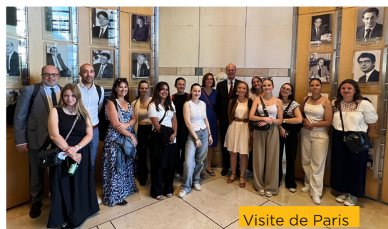
Visite de Paris