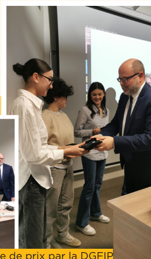
Remise de prix par la DGFIP