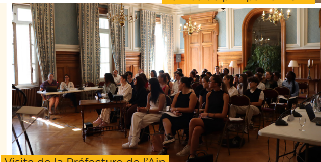
Visite de la Préfecture de l'Ain