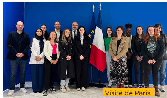
Visite de Paris