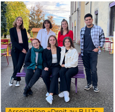
Association «Droit au B.U.T»