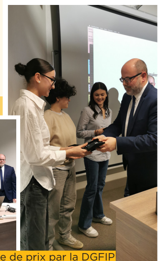
Remise de prix par la DGFIP