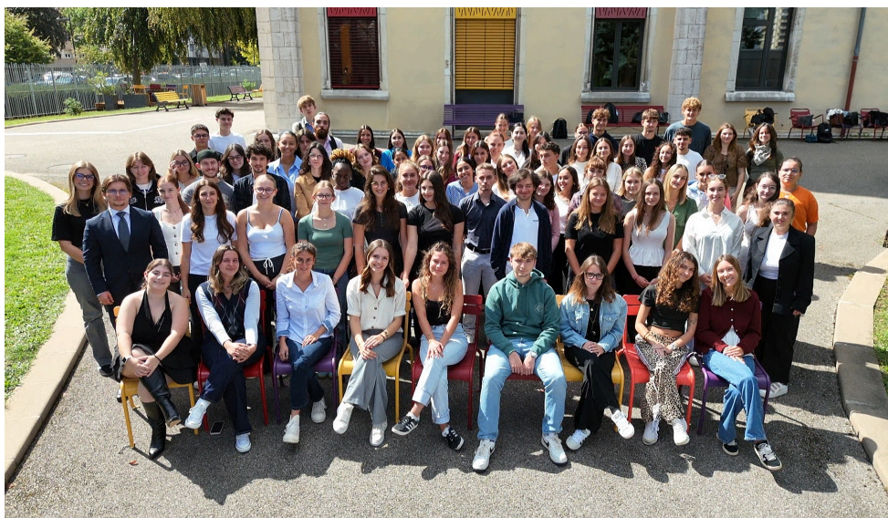
Promotion de licence 2ème année - 202526