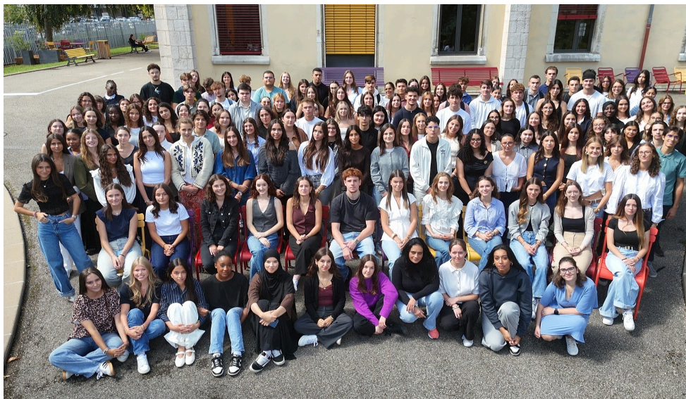
Promotion de licence 1ère année - 202526